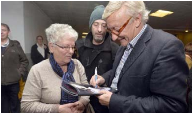
L'acteur Olivier Lejeune est attendu dimanche à partir de 13 heures.

À 65 ans, l'ancien camarade de classe de Gérard Jugnot est un touche-à-tout. Au cinéma, il est apparu dans « Rabbi Jacob » au côté de Louis de Funès qui est son « héros au même titre que Sacha Guitry ». Début des années 90, c'est à la télévision qu'Olivier Lejeune s'est montré brièvement avec le jeu : « Joyeuses plaques » sur TF1, avant de se rendre en Belgique pour animer l'émission « Bon week-end » sur la RTBF. Dans les médias, il a également plus récemment participé à l'émission « Les Grosses Têtes », animée à l'époque par Philippe Bouvard. Malgré tous ces succès, c'est au théâtre que le natif d'Orléans semble s'épanouir le plus. Actuellement à